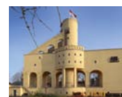
Stichting "Eygelshoven door de eeuwen heen"